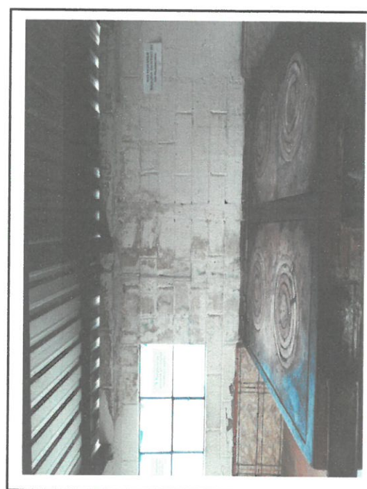
Foto 5: Sustitución de planchas de metal por planchas de metal nuevas y pintada de paredes

Observación: Si es necesario se pueden agregar hojas adicionales. Analizar el número de hojas.