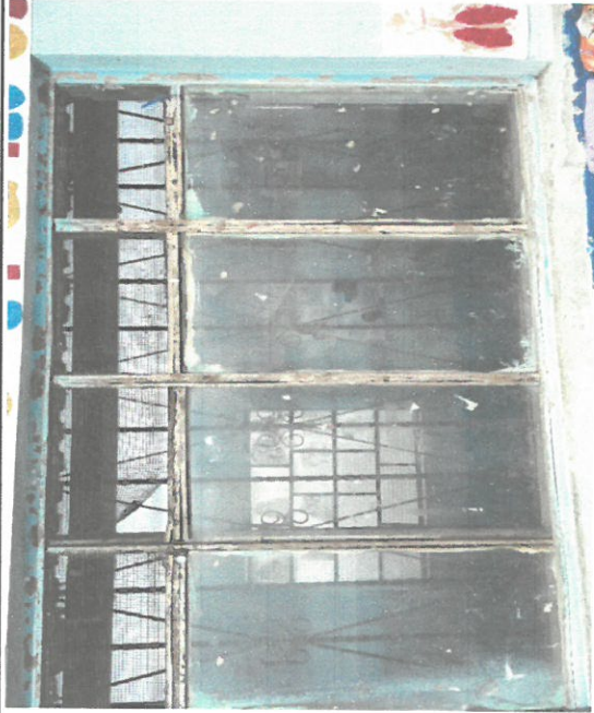
Foto 1: Sustitución de marcos de madera por marcos de PVC. Sustitución de vidrios lisos por vidrios reflectivos.